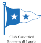
Club Canottieri Roggero di Lauria